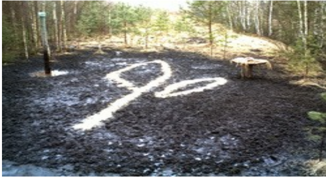
Metssigade pidulaud 24. veebruaril 2008

Millal lugeja ise viimati metsas käis ja seal mõnd metsloomaga nägema trehvas?